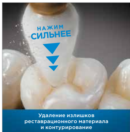
Удаление излишков реставрационного материала и контурирование