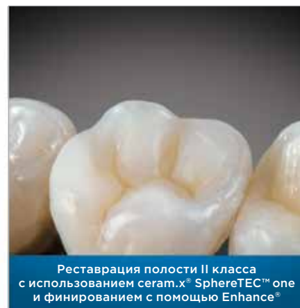
Реставрация полости II класса с использованием ceram.x® SphereTEC™ one и финированием с помощью Enhance®