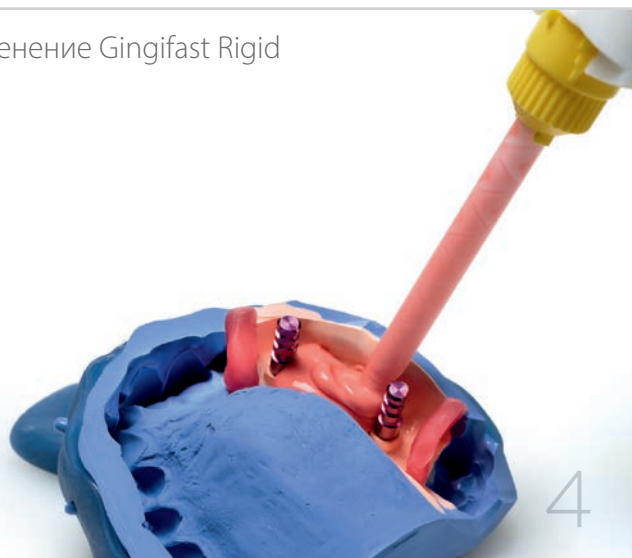
Применение Gingifast Rigid